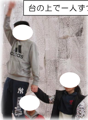
台の上で一人ずつ紹介