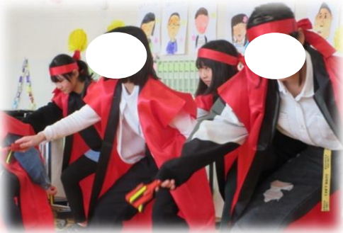
6年生からの出し物①「よさこい」（迫力満点&かっこいい）