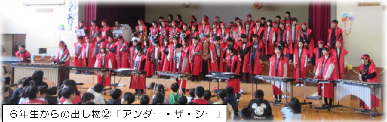
6年生からの出し物②「アンダー・ザ・シー」