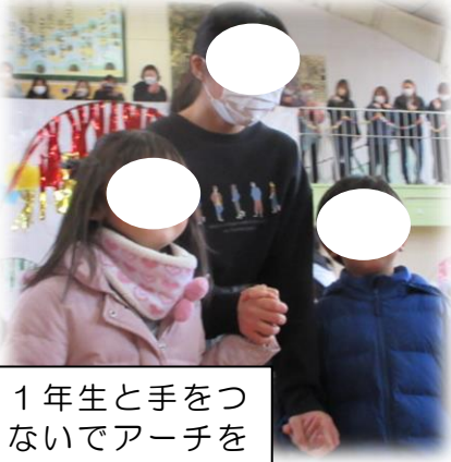
1年生と手をつないでアーチをくぐり入場

3月7日（木）の13：25～、6年生を送る会が開催されました。その様子をご紹介します。