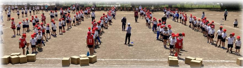
聖火入場 (150周年 記念セレモニー) 地域代表⇒保護者代 表⇒1・2・3・4・ 5年生代表⇒応援団 長による点火 ※体育主任作成