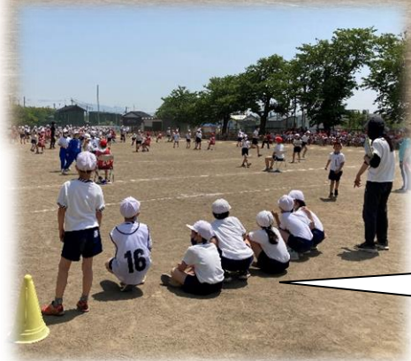
戦国ジャンケンで 勝ち残った子ども