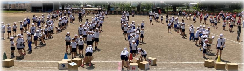
Jチーム種目 運んで つんで わくわく 段ボール