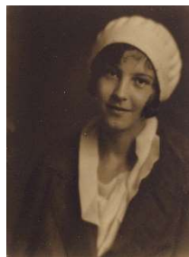
堺時雄《ソフィア(婦人像 正面)》 1926年〔「堺時雄 ピクトリアリズムへの招待」より〕

展示室1 近代美術館の名品 展示室2 命脈 一命と美のつながり— 展示室3 堺時雄 ピクトリアリズムへの招待